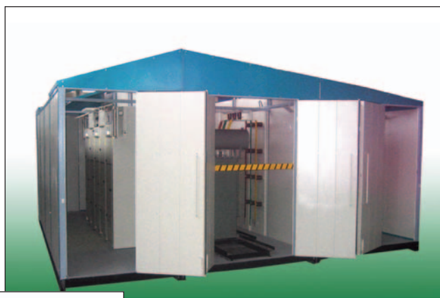
Комплексна модульна двотрансформаторна підстанція сендвічного типу 2МКТПУ/EL-400-10/0,4 У1

Однією із новинок, які пропонує наше підприємство, є комплектні трансформаторні підстанції в монолітній бетонній оболонці. Важливою особливістю таких підстанцій є швидка установка на місці і включення їх як тупикових чи прохідних. Досить важливим в сучасних умовах є те, що текстура та