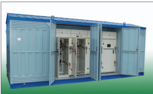
Комплексна двотрансформаторна підстанція контейнерного типу 2КПТУ/EL-630-10/0,4 У1