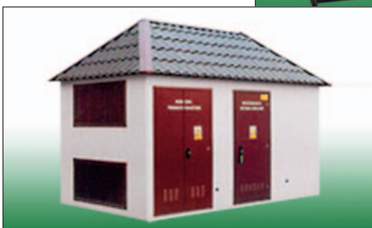
Комплексна трансформаторна підстанція в бетонному корпусі з внутрішнім коридором обслуговування

колір покриття виконуються відповідно до вимог замовника. Колір корпусу, даху, декоративних елементів та дверей замовник може підібрати за своїм смаком, щоб вписати підстанцію в загальний дизайн міського мікрорайону або виконати в фірмовій гаммі конкретного підприємства.