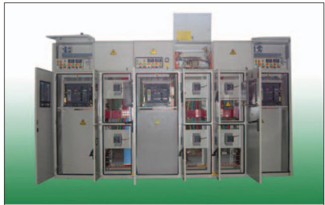
Комплексна двотрансформаторна підстанція типу 2КПТУ/EL25006/0,4 УЗ